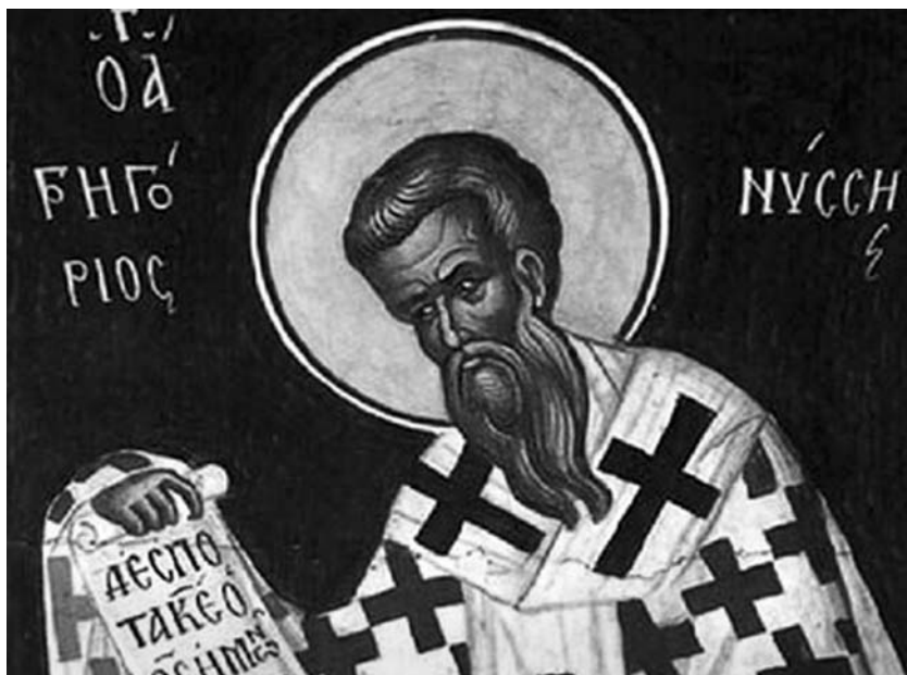
Иером. Кирилл (Зинковский) Представления о материи и теле в трудах свт. Григория Нисского