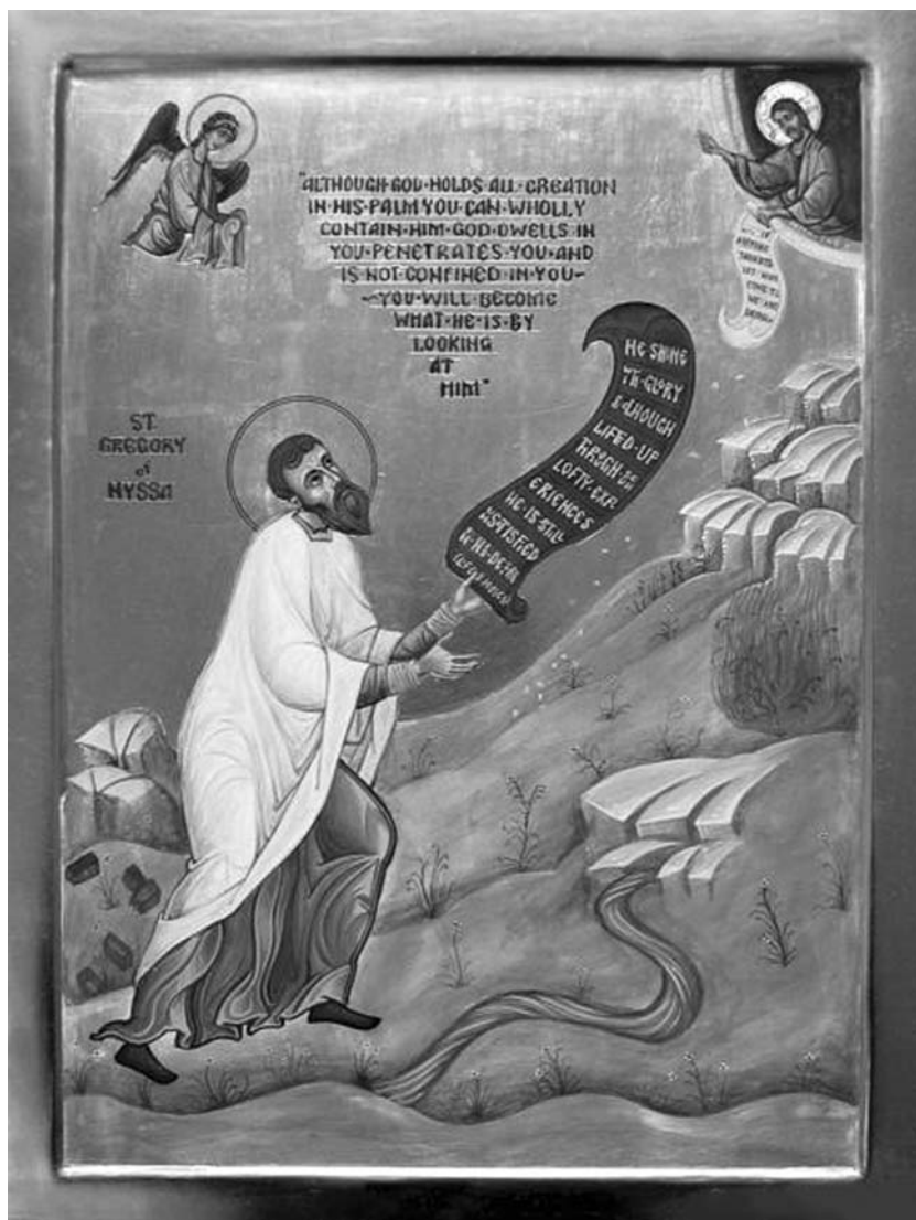
Свт. Григорий Нисский. Греческая икона

рые, в сущности, нематериальны” 27 . Таким образом, снимается чисто логическое затруднение: как чуждый материальности Бог-Творец, будучи чистым Духом, мог положить начало бытию грубого материального мира, имеющему качественно иные, и даже противоположные духу, свойства.