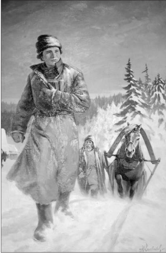
Юный Ломоносов на пути в Москву. Н. И. Кисляков

ходящих» (26 ноября 1753 года), «Слово похвальное Петру Великому» (26 апреля 1755 года), «Слово о происхождении света, новую теорию о цветах представляющее» (1 июля 1756 года), «Слово о рождении металлов от трясения земли» (6 сентября 1757 года), «Рассуждение о большой точности морского пути» (8 мая 1759 года), «Рассуждения о твердости и жидкости тела» (6 сентября 1760 года).